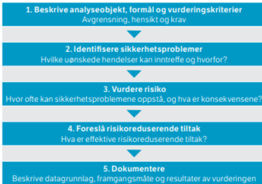
Figur 1 Risikovurderingens 5 trinn