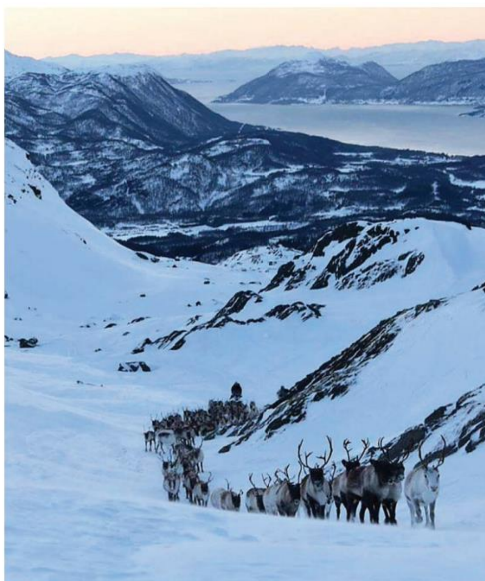
Hjertind reinbeitedistrikt; reintrekk i Børringen