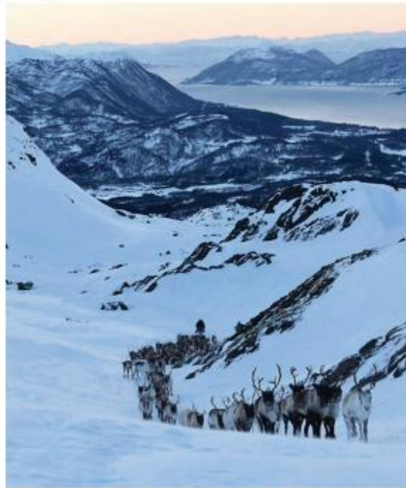
Hjertind reinbeitedistrikt; reintrekk i Børringen