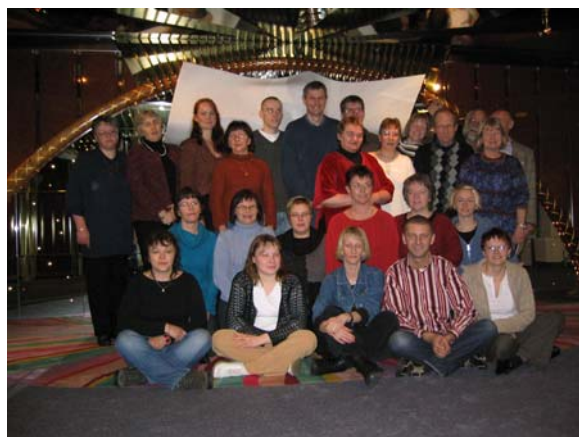
Glad gjeng som her nesten er tilbake i Tromsø igjen.

Turen ble mye mer spennende en vi kunne forestille oss. Heldigvis ble ingen sjøsyk og alle var enige om at dette var en kjempeflott tur. (At samme båt lengre sør på ruta fikk motorstopp i full storm gjorde bare minnene enda sterkere)