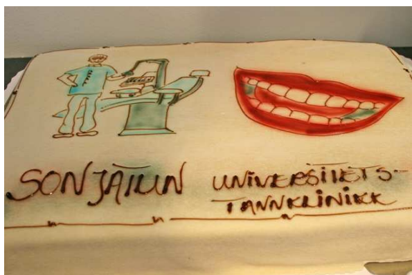
Kake for anledningen

De ansatte ved klinikken fremførte en nyskrevet sang, og den sier vel det meste: