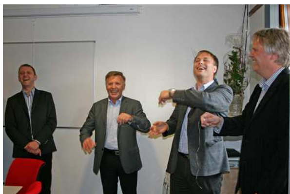
Høytidelig klipping av tanntråd