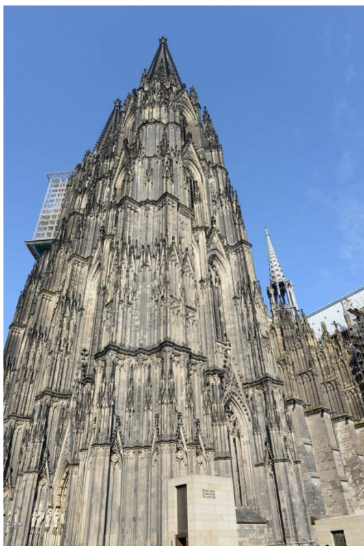
Kölnerdomen med sine 156 meter høye tårn